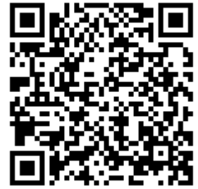
報名用 QR Code

三、為因應新型冠狀病毒肺炎(COVID-19)疫情，每場次報名人數上限 20人 （額滿截止報名），若報名後臨時無法參加請通知我們，我們將此名額給予下一位候補參與者。